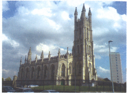
Anglikanische Kathedrale, Liverpool; St. George's Church, Hulme