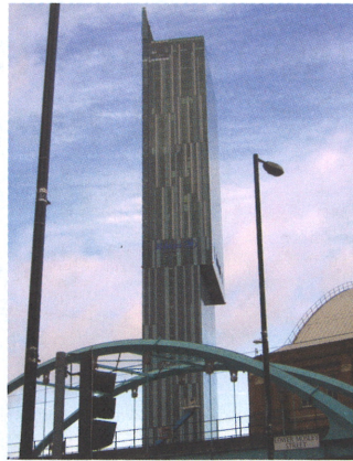
Civil Justice Centre; Hilton Hotel

Konzerthaus Bridgewater Hall, Barbirolli Square, RHWL Partnership, 1996. Gateway House, Station Approach, Richard Seifert & Partners, 1969.