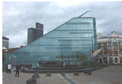
Lowry Arts Complex; Urbis, Centre for Urban Culture