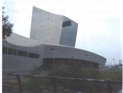
Imperial War Museum, Daniel Libeskind