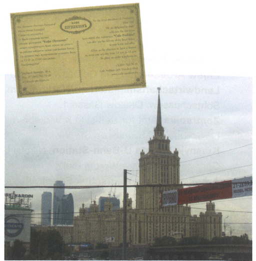
Roter Platz; Moskau City, „Sieben Schwestern“