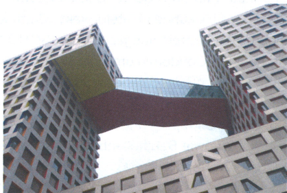
Commune by the Great Wall; MOMA Linked Hybrid