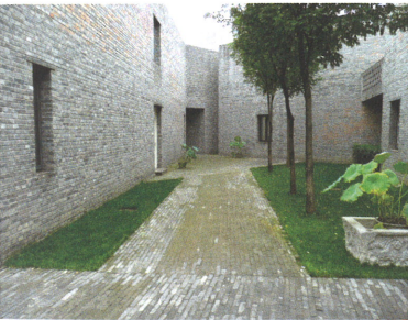
Caochangdi Village; National Stadium; Nationaltheater; CCTV

21.00 Abendessen im Green T. House , 6 Gongtixilu Chaoyang, schick inszeniertes lukullisches Erlebnis.