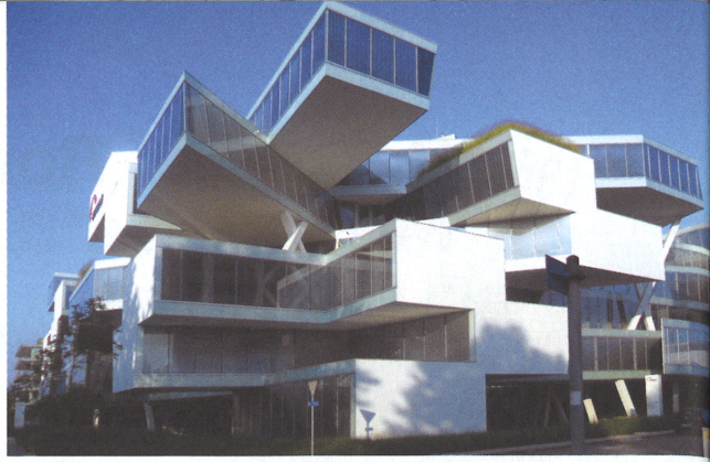
Novartis Campus, Forum 3; Actelion Business Center