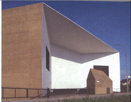
Chapelle Notre Dame du Haut in Ronchamp; Schaulager

09.15 Schleusenverkehr- und Kontrollturm des Rhein-Rhone-Kanals in Kembs-Niffer, Le Corbusier , 1962 – relativ unbekanntes Spätwerk, durchaus sehenswert.