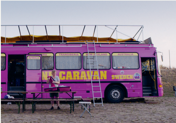
Rast, R.: Iris Blauensteiner, 2016

Ein Leben in permanenter Bewegung, minimaler privater Lebensraum und geteilte Infrastrukturknoten – so sahen die Utopist*innen der 60er Jahre die Zukunft. Und tatsächlich findet man heute vermehrt Menschen, die diese Lebensweise – freiwillig oder unfreiwillig – angenommen haben.