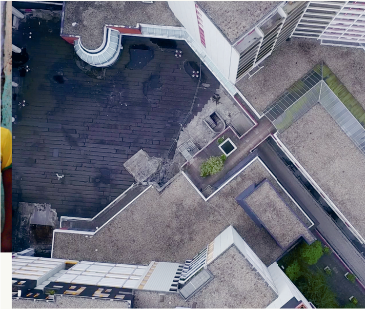
Das Ihme-Zentrum – Traum Ruine Zukunft, R: Constantin Alexander & Hendrik Millauer, 2016

Das Ihme-Zentrum – Traum Ruine Zukunft , DE 2016, 45:00 min, dOF, R: Constantin Alexander & Hendrik Millauer