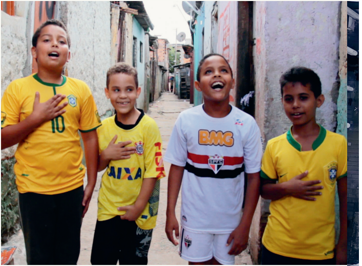
The March of the White Elephants, R: Craig Tanner, 2015

Auch in wachsenden Städten kommt es vor, dass ganze Gebäudekomplexe leer stehen. Viele dieser Architekturen wurden ursprünglich als Statussymbole gebaut und sind inzwischen überflüssig geworden.