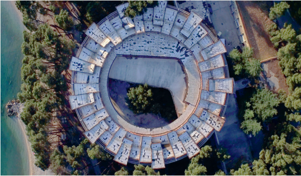
Slumbering Concrete - extended teaser, R: Saša Ban, 2016

Stadterweiterung und Nachverdichtung verdrängen oft alteingesessenes Gewerbe, andererseits bringen neue Nutzungen auch neue Tätigkeiten in die Stadt.