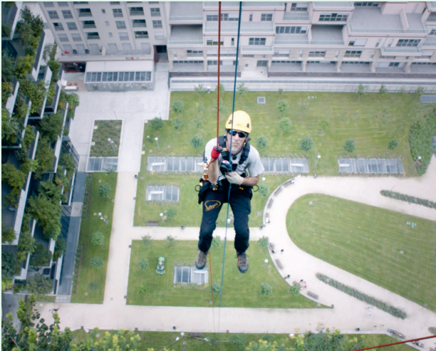
The Flying Gardeners, R: Giacomo Boeri & Matteo Grimaldi, 2015